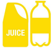
Botol dan wadah plastik