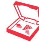
Kardus berma- kanan

Barang-barang ini tidak dapat dibuang ke wadah tepi jalan. Bawalah ke pusat daur ulang setempat.