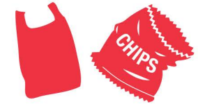
Plastik lunak atau bawa ke wadah REDcycle bertanda merah