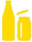
Botol dan stoples kaca